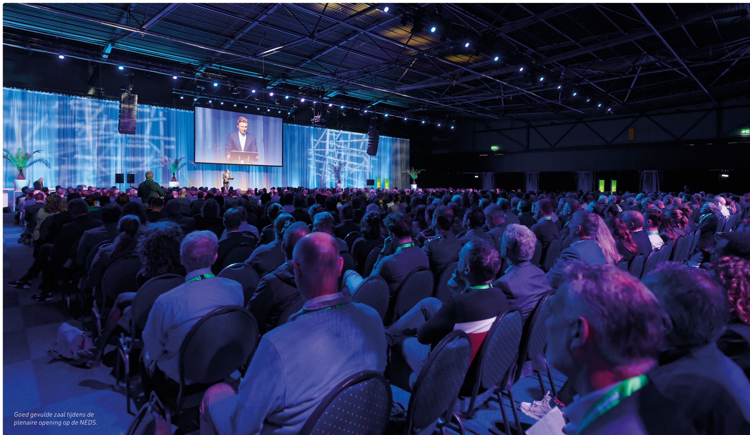
Goed gevulde zaal tijdens de plenaire opening op de NEDS.

Spullen schafte Defensie aan onder het credo: 'Het beste product voor de beste prijs', aldus Knops. "Er was altijd wel een bedrijf dat wilde leveren, wat het Nederlandse ministerie van Defensie goed uitkwam, aangezien het politieke klimaat weinig ruimte liet