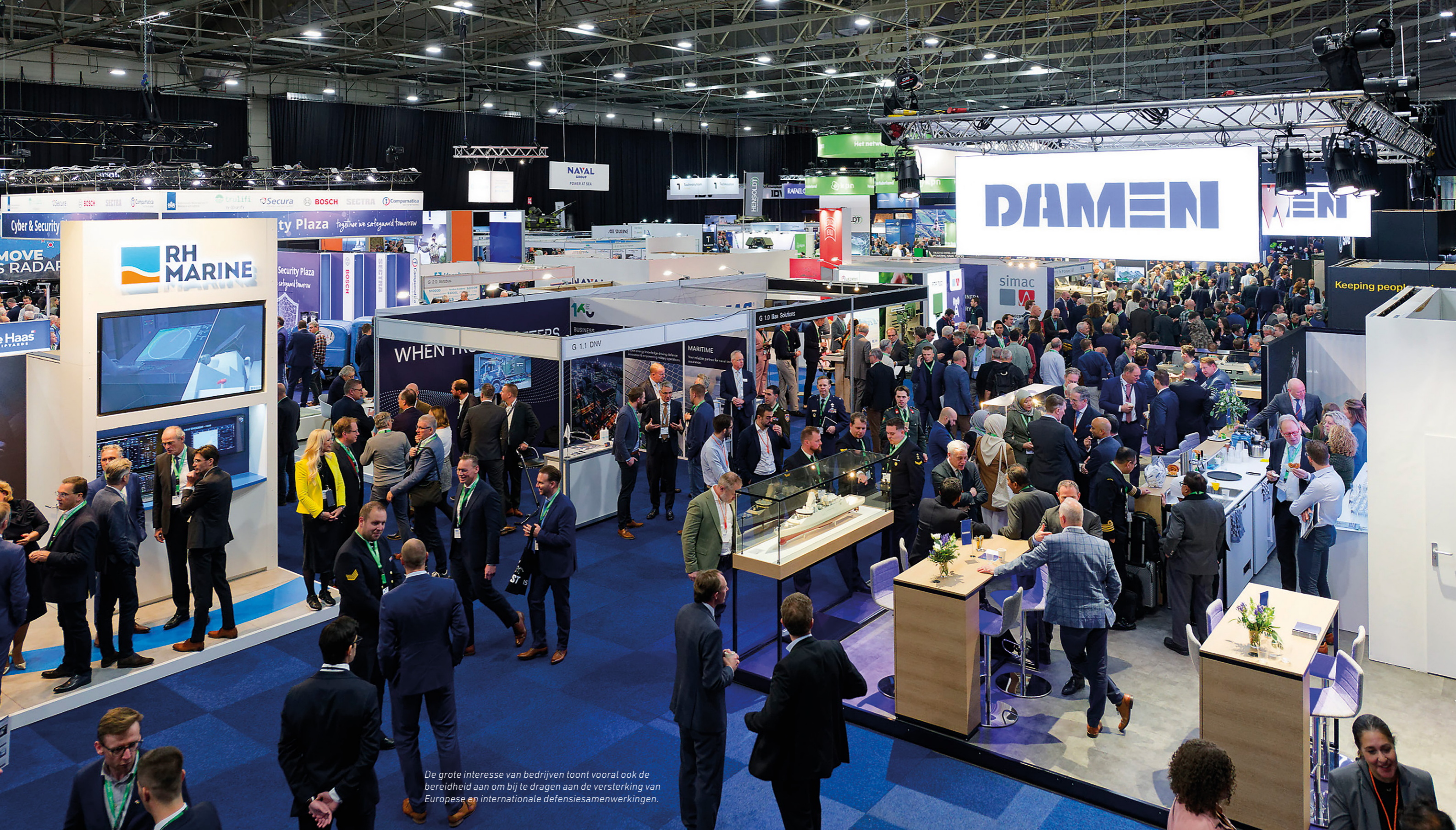
De grote interesse van bedrijven toont vooral ook de bereidheid aan om bij te dragen aan de versterking van Europese en internationale defensiesamenwerkingen.

belang van trans-Atlantische samenwerking benadrukte. US DoD heeft met een aantal Nederlandse bedrijven gesproken over participatie van de Amerikaanse overheid in het testen en valideren van hun producten. De Amerikaanse overheid heeft budget beschikbaar om de kosten van testen en valideren voor haar rekening te nemen.