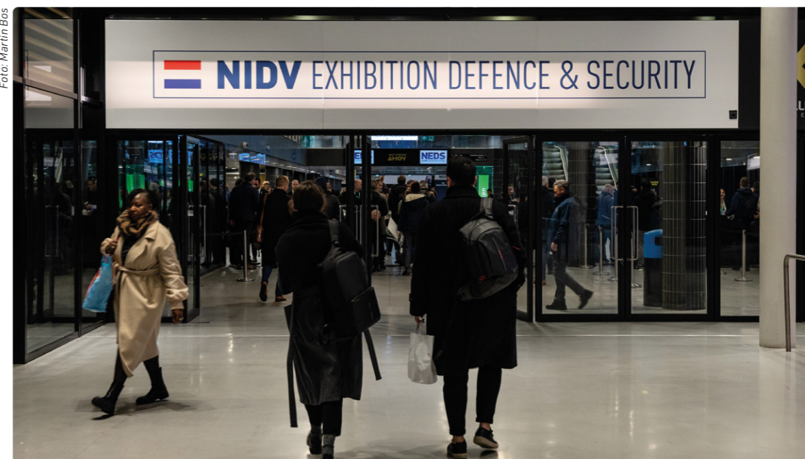
De NEDS heeft vooral een netwerkfunctie.